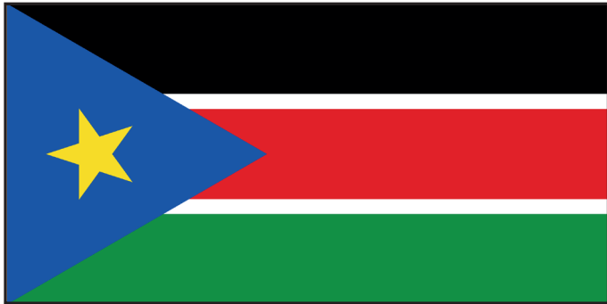
Dit is de vlag van Zuid-Soedan.